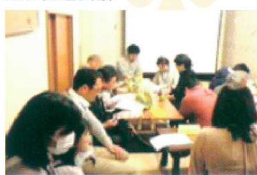
地域の方々にもご参加頂く運営推進会議