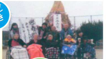
日常生活リハビリ・作業療法